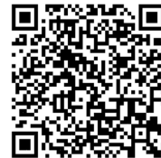
衛生福利部食品藥物管理署