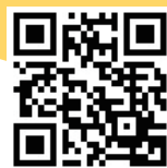
衛生福利部食品藥物管理署