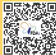
智慧醫療器材資訊暨媒合平台

辦理系列、初中高階之醫材法規及品質管理系統(QMS)培訓課程，滿足業界對法規人才及知能需求。